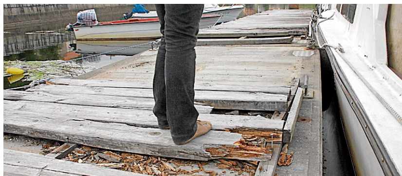
Estado actual de los pantalanes de atraque de Ponte Nafonso.