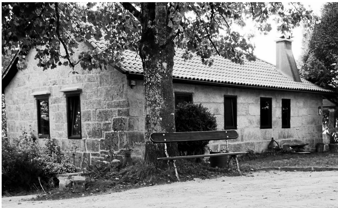
La empresa está situada en una finca con varios siglos de historia, "A Quinta das Cabadas", en Pontevedra.